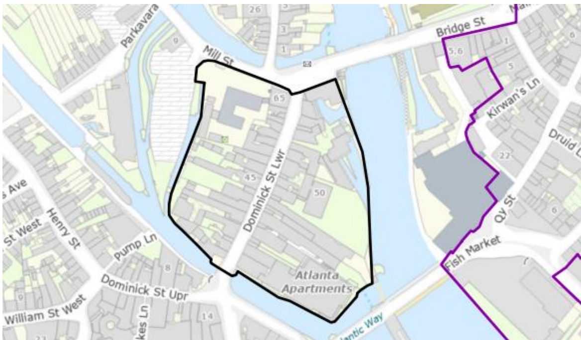
Limistéar Caomhantais Ailtreachta (LCA) Shráid Dhoimnic Íochtarach